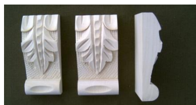
119. List krátký