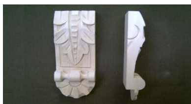
105. List s patkou nízký