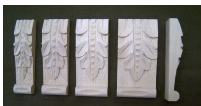
101. List klasik