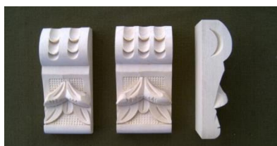
118. Švestka krátká