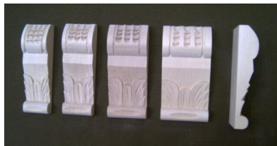
115. List spodní

š 35, 40, 45 x v 120 x hl 20 š 50, 60 x v 120 x hl 20