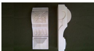
111. Růže gigant