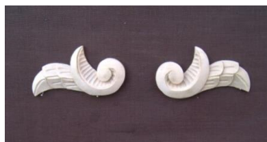
9. Křídlo (levé, pravé)