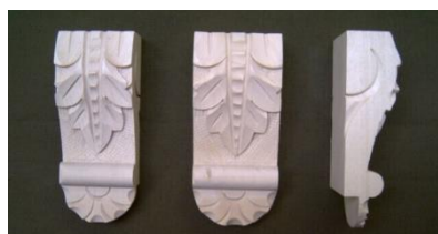
104. List s patkou vysoký