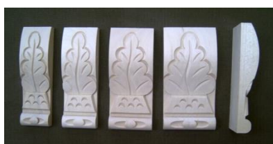
117. List dubový