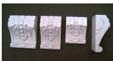
107. List velký

š 80 x v 190 x hl 60 740,-/ks š 140 x v 340 x hl 60 na poptávku