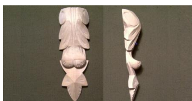
122. Rohová řezba