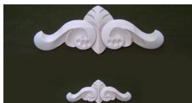
108. Horní řezba vyšší

š 385 x v 146 x hl 12 740,-/ks š 190 x v 78 x hl 8 280,-/ks