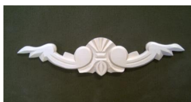
13. Horizontální řezba