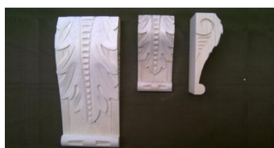
106. List velký

š 80 x v 190 x hl 60 740,-/ks š 140 x v 340 x hl 60 na poptávku