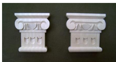
110. Antický sloupek

š 400 x v 121 x hl 12 707,-/ks š 205 x v 60 x hl 8 247,-/ks