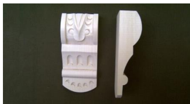
113. Indonézská řezba