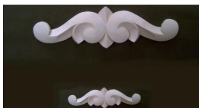
109. Horní řezba nižší

š 385 x v 146 x hl 12 740,-/ks š 190 x v 78 x hl 8 280,-/ks